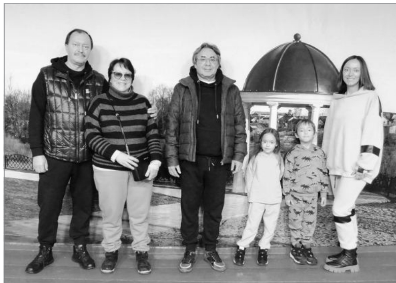
Потомки Любимовых. Гости из Москвы